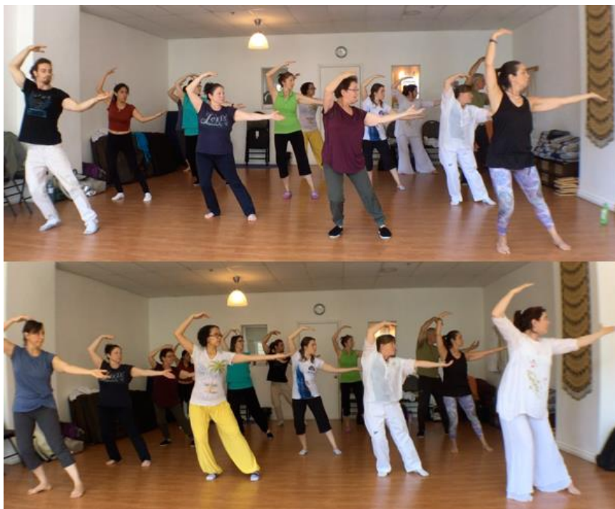
Démonstration des élèves 2016-2017, série 1 du Taiji Qigong Shibashi

La formation d'enseignant en Qigong thérapeutique a lieu durant un samedi par mois. Pour les dates, le lieu et les prix, voir la fiche d'inscription.